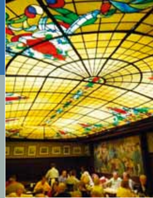
Peters Brauhaus 50667 Köln www.peters-brauhaus.de

Die Qualitätssicherungsvereinbarung Zervix-Zytologie der Kassenärztlichen Bundesvereinigung (KBV) vom 1. Oktober 2007 fordert von zytologisch tätigen Ärzten und ihren Mitarbeitern den Nachweis von 40 Gynäkologisch themenbezogenen Fortbildungsstunden pro 2 Jahre. Bitte reichen Sie die entsprechenden Zertifikate bei Ihrer Kassenärztlichen Vereinigung ein.